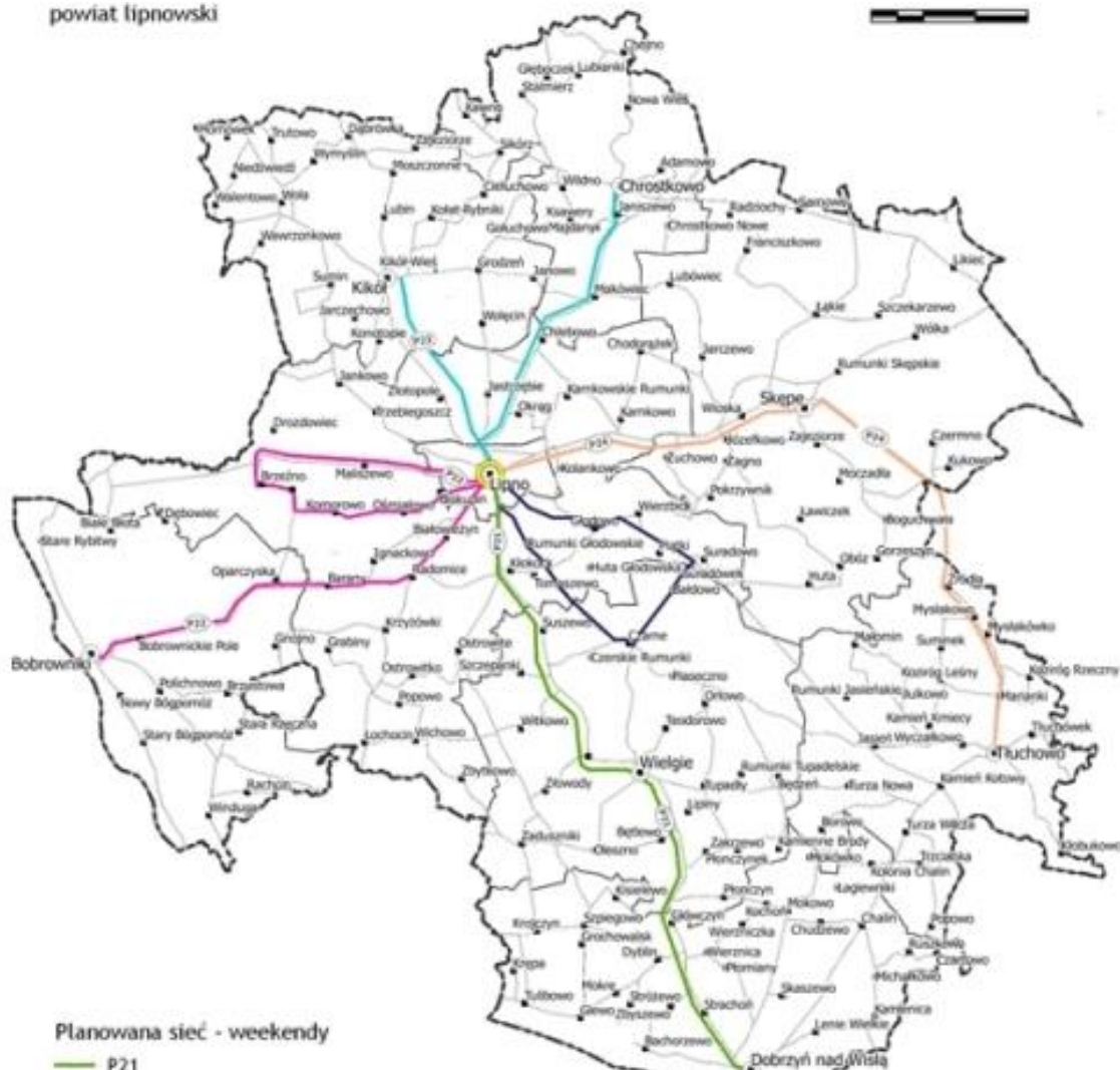
Planowana sieć - weekendy