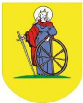
MIASTO I GMINA DZIERZGOŃ